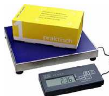
Váživost 6 - 70 kg