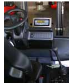
KPZ 39 Váha pro hydraulické vysokozdvizné zařízení

Potřebujete jinou váhu, zvláštní produkty jsou naše specialita !