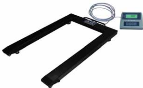
Počítací váha Typ: KPZ 1

počítání kusů na základě vzorkování: lze vzorkovat 10, 20, 50, 100 a 200 kusů.