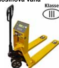
KPZ 71-7 Paletový vozík s váhou