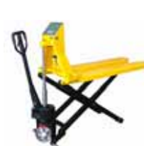
KPZ 74 Paletový vozík s váhou