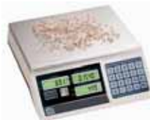
KPZ 2-04 Počítací váha