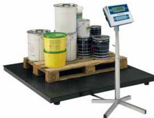
Počítací váha Typ: KPZ 2