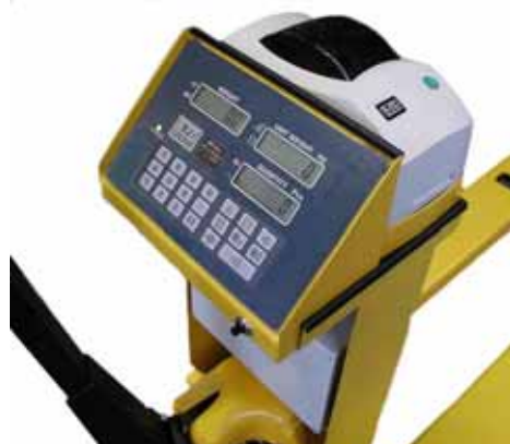
Počítací váha Typ: KPZ 71- *

KPZ - Váhy, s.r.o. • Libošovice 76, • CZ 507 44 Libošovice