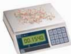
KPZ 2-03 Přesná váha