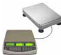
KPZ 2082 Systém počítacích vah