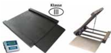
KPZ 2D Nájezdová (průjezdová) váha